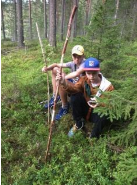
Tarpojat valvoivat merirosvo- koetusta