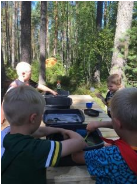
Tiskaaminen sujui mukavasti uudella, tarpojaporukan raken- tamalla tiskipöydällä.