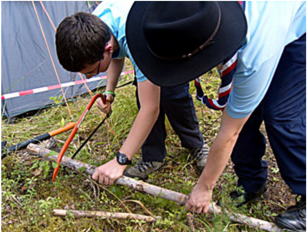
Tom ja Matt tekemässä telttakeppejä

laiset pääsivät tekemään itselleen telttakepit ja kiilat saatuaan käsiinsä vain telttakankaat ja neuvon käyttää puukkoa, kirvestä ja sahaa. Leiripaikka oli keskellä raivaamatonta mäntymetsää, maassa oli kaatuneita puita ja männynneulasia, joten ympäristö oli aivan